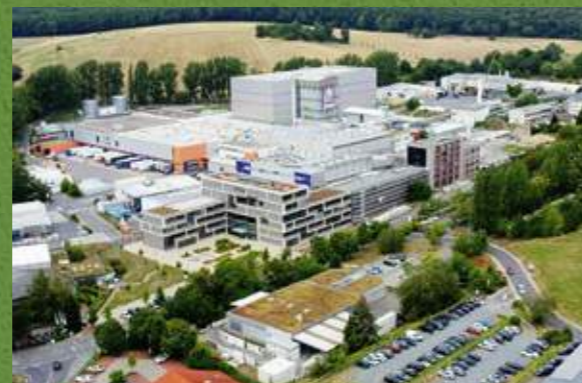
Le siège de DAW à Ober-Ramstadt

Nous sommes signataires du Pacte Mondial des Nations Unies depuis 2012 et rendons compte chaque année de nos progrès en matière de durabilité.