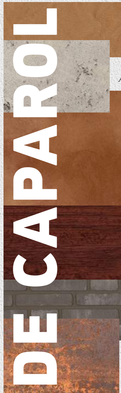
Stucco Decor Di Luce